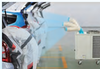
お好みの角度に調節可能(手動)なトリプルダクトで、より広範囲にスポット冷風を送ります。