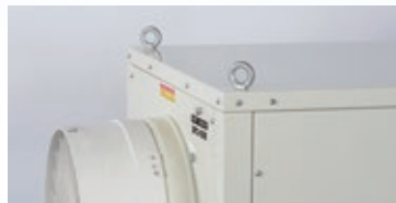
アイボルト 吊り下げ移動ができます。