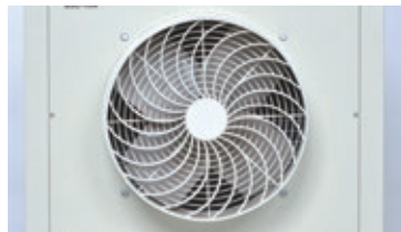
送風口 トルネードガード採用で風の直進性アップ。