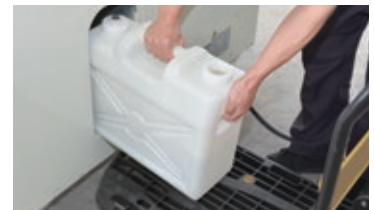
排水口が無い場所でも使用できるドレンタンク式